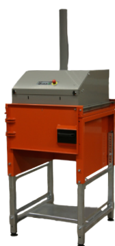
Jednokomorová varinata s křídlovými dveřmi