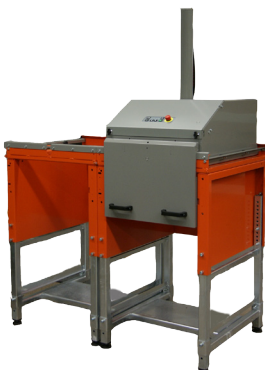
Vícekomorová varianta s posunem lisovací jednotky